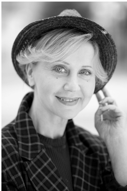
Eszenyi Enikő, színházi rendező, színpadi és filmszínésznő:

A budapesti Színház- és Filmművészeti Főiskolán tanult, 1983-ban színésznői diplomát szerzett. A diploma megszerzése után a budapesti Vígszínház társulatához szerződött, 2009. február 1-jén nevezték ki a Vígszínház művészeti igazgatójává, ezt a pozíciót 2020. június végéig töltötte be. Első rendezése színházigazgatóként Büchner Leonce és Lénája volt a Budapesti Kamaraszínházban, amely produkció hét díjat kapott a Magyar Színházi Fesztiválon, 1991-ben. A következő években több olyan darabot állított színpadra, amely a szakma és a közönség elismerését is kivívta itthon és külföldön egyaránt. Rendezett Pozsonyban, Prágában, de eljutott a washingtoni Arena Stage-hez, ahol 2004 januárjában Brecht Egy férfi az ember című darabját állította színpadra, de más munkáját láthatták a dél-koreai Szöulban is. Közben színésznőként is nagyon sikeres pályát futott