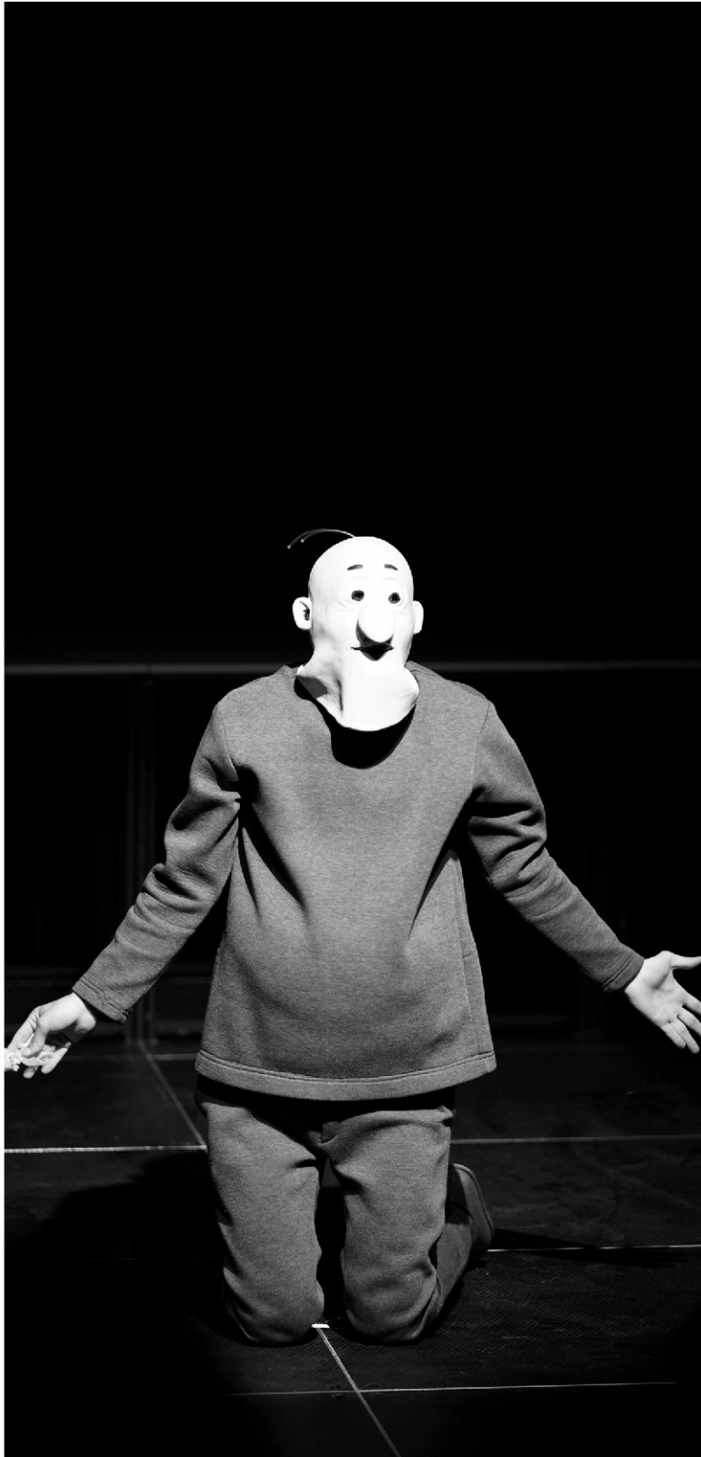
Gusztáv a hibás mindenért - a szabadkai Kosztolányi Dezső Színház előadása, rendező: Kokan Mladenović

XXII. évfolyam 1. szám - 2020. augusztus 22. szombat