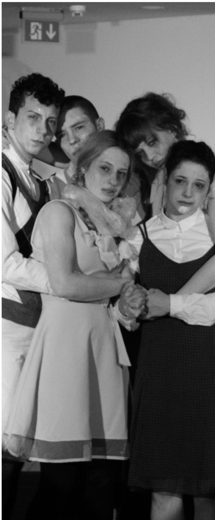
A tavasz ébredése

XX. évfolyam 8. szám – 2018. június 30. szombat